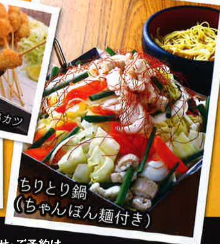
ちりとり鍋 (ちゃんぽん麺付き)