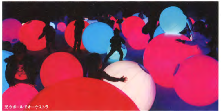
光のボールでオーケストラ

チームラボとは | プログラマー、エンジニア、CGアニメーター、絵師、数学者、建築家、ウェブデザイナー、グラフィックデザイナー、編集者など、デジタル社会の様々な分野のスペシャリストから構成されているウルトラテクノロジスト集団。アート・サイエンス・テクノロジー・クリエイティビティの境界を曖昧にしながら活動している。 teamlab.art/jp