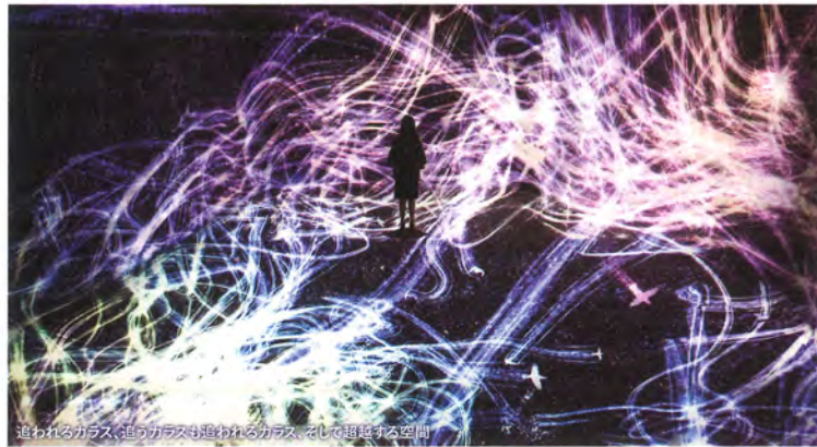
追われるガラス、追っガラスも追われるガラス、そして超越する空間