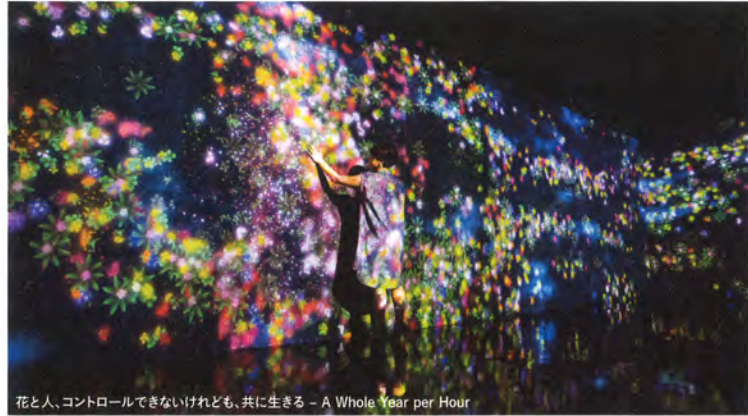
花と人、コントロールできないけれども、共に生きる - A Whole Year per Hour