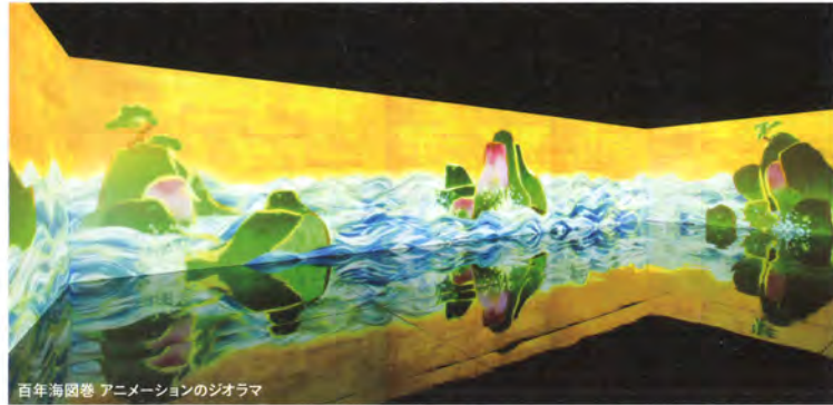
百年海図巻 アニメーションのジオラマ