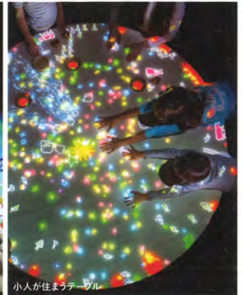
小人が住まうテール