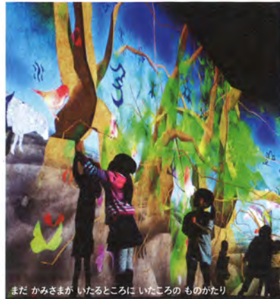
まだ かみさまが いたるところに いたころの ものがたり