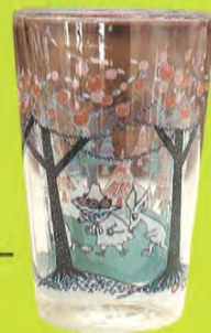
ダブルグラスタンブラー (FOREST) 税込3,780円