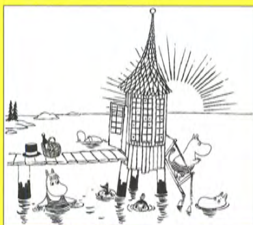
「ちびのミイがやってきた!」下絵原画