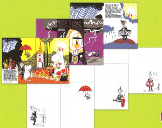
メッセージカード(3種) 各 税込540円