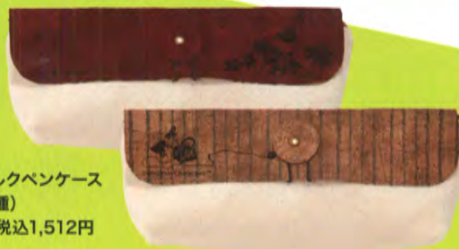
コルクペンケース (2種) 各 税込1,512円