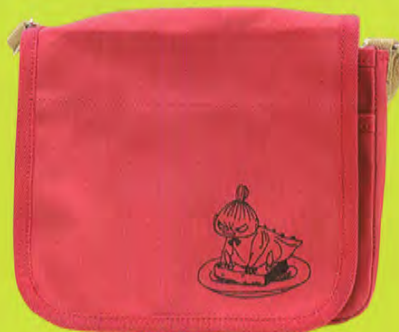
一澤信三郎帆布ショルダーバッグS(赤) 税込9,720円