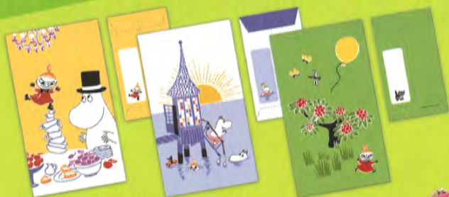
ポチ袋(3種) 各 税込378円