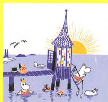
「ちびのミイがやってきた!」彩色原稿