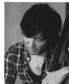
ベース 鳥越 啓介

東京芸大卒。1989年ツインバイオリンのバンド「Gクレフ」でデビュー。NHK紅白歌合戦に白組で初出場。その後ソロデビュー。2005年オリジナルアルバム『WALKIN' TOMORROW』発表。作曲、録音、舞台等で活動中。