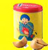
福来る めでタイクッキー ~たけしのありがたみおみくじ付き~

※販売状況により売り切れの場合がございます。 ※商品価格は実際の商品と若干異なる場合がございます。