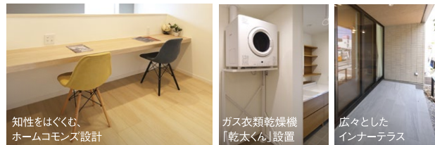
知性をはぐくむ、ホームcommons設計 ガス衣類乾燥機「乾太くん」設置 広々としたインナーテラス