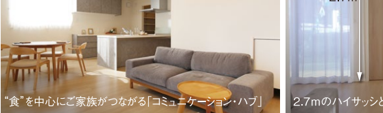
“食”を中心にご家族がつながる「コミュニケーション・ハブ」 2.7mのハイサッシとハイドア 隣接したパントリーと洗面所 家事ラク動線 宅配ボックス

お支払い例 月々 68,114円 (税込) 分譲価格/48,832,497円 (税込・諸費用別) ボーナス月支払い(年2回) 178,444円 自己資金/6,032,497円 ※借入/42,800,000円 ※住信SBIネット銀行 40年返済 変動金利 年0.470% ※2023年10月31日現在