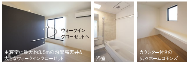
ウォークインクローゼットへ 主寝室は最大約3.5mの勾配高天井 & 大きなウォークインクローゼット 浴室 カウンター付きの広々ホームcommons