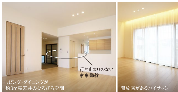
リビング・ダイニングが約3m高天井のひろびろ空間 行き止まりのない家事動線 開放感があるハイサッシ

5号地のお支払い例 月々 77,257円 (税込) 分譲価格/54,025,369円 (税込・諸費用別) ボーナス月支払い(年2回) 192,170円 自己資金/6,225,369円 ※借入/47,800,000円 ※住信SBIネット銀行 40年返済 変動金利 年0.470% ※2023年10月31日現在