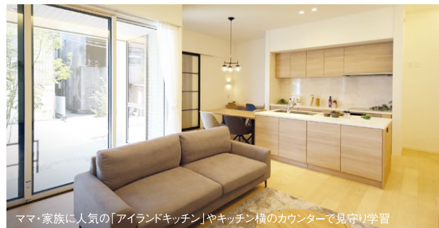
ママ・家族に人気の「アイランドキッチン」やキッチン横のカウンターで見守り学習

2号地のお支払い例 月々 74,971円 (税込) 分譲価格/51,910,840円 (税込・諸費用別) ボーナス月支払い(年2回) 178,444円 自己資金/6,110,840円 ※借入/45,800,000円 ※住信SBIネット銀行 40年返済 変動金利 年0.470% ※2023年10月31日現在